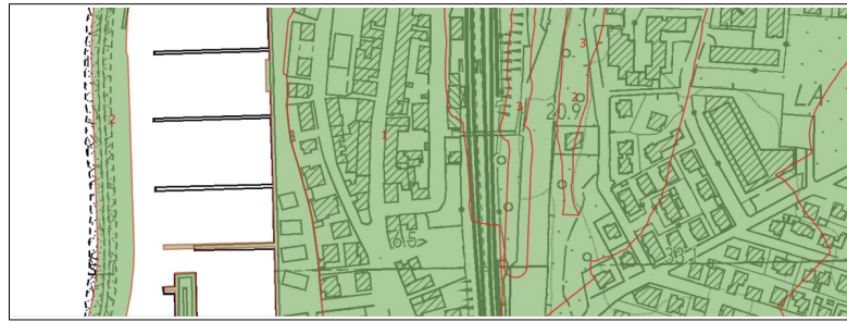
Pericolosità Geologica PG1